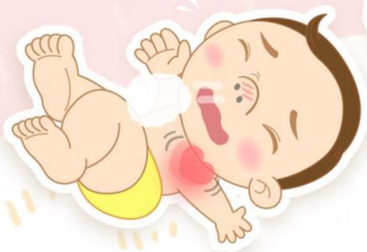
呼吸急促心跳加快